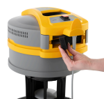
Prese ingresso e uscita aria raffreddamento